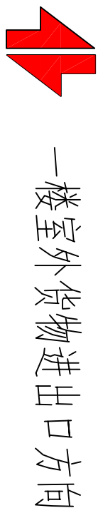
升降平台平面布置图